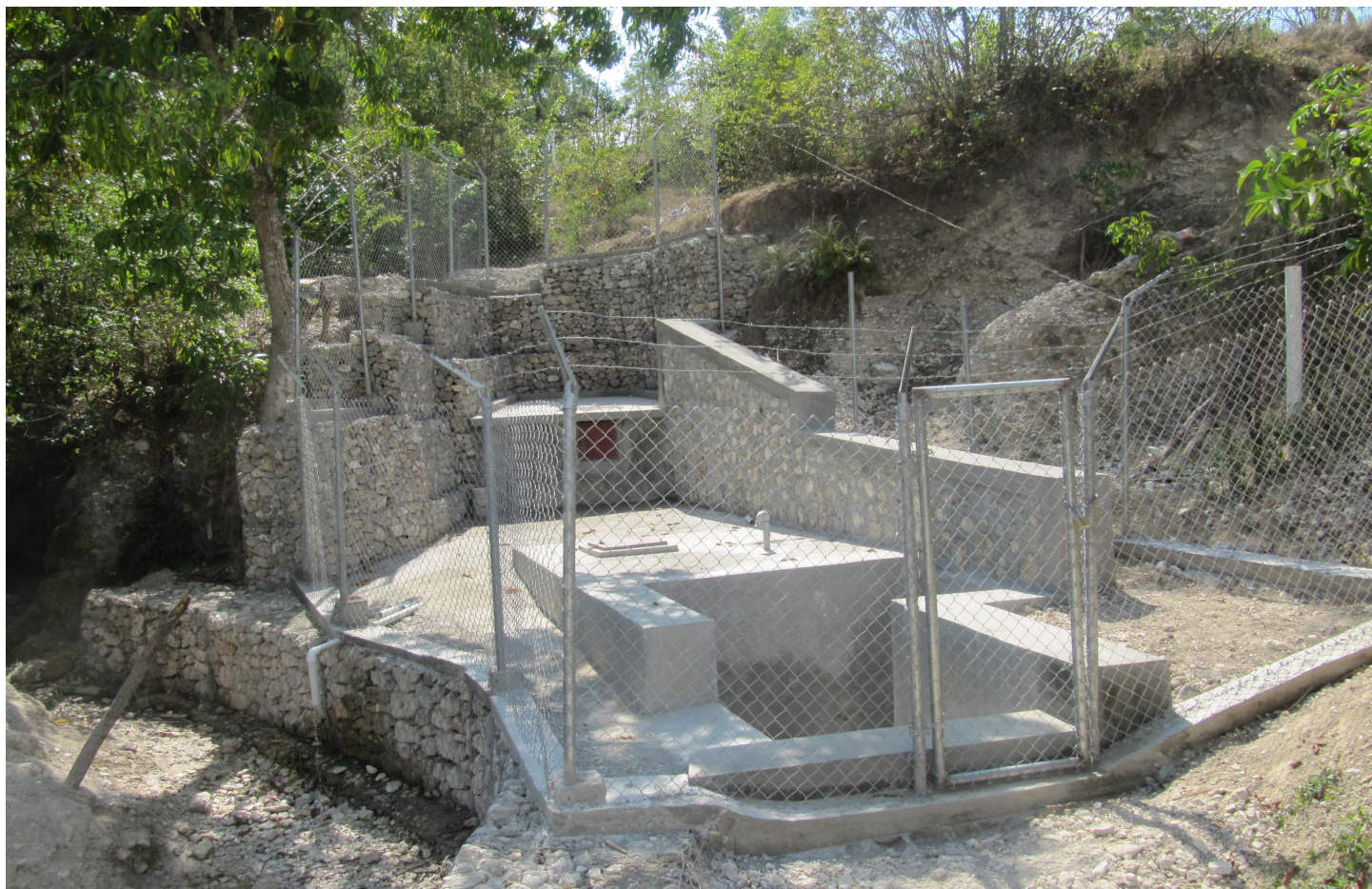
Point d'eau à 5ème section de Verrettes

Le choix et l'emplacement de ces ouvrages sont faits de concert avec les usagers. La distance entre kiosques est comprise entre 200 et 400 mètres. Des espaces isolés sont quelques fois construits pour permettre au gens de se baigner à l'aide de seaux. La construction de lavoir-bain est prohibée en raison des problèmes de gaspillage d'eau et d'assainissement posés par ces types d'ouvrages. Et lorsqu'ils existaient sur un SAEP réhabilité par le projet, ils sont tout simplement transformés en kiosque.