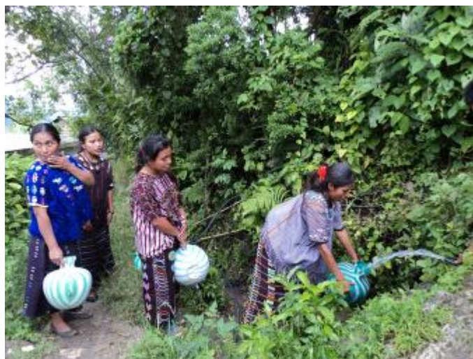
Acarreo de agua antes de la construcción del sistema de agua potable.

El concepto implementado en la Comunidad El Chorro, tuvo como objetivo : aumentar la cobertura de agua potable y saneamiento, mejorar la calidad del sistema existente y asegurar su mantenimiento; a través del desarrollo de capacidades y el fortalecimiento de los servicios comunitarios para una gestión eficiente y sostenible de los mismos. Se implementó un trabajo integral de salud y saneamiento que incluyó el abastecimiento de agua y saneamiento, educación sanitaria, fortalecimiento comunitario e institucional, escuelas saludables y gobiernos escolares, así como salud ambiental y familiar.